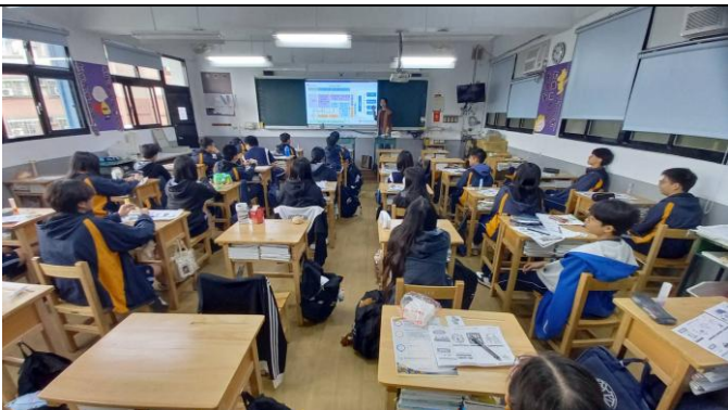
說明:理財課程講解